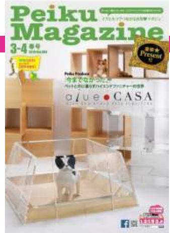
画像クリック デジタルペクマガ