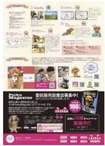
プレゼント協賛ページ